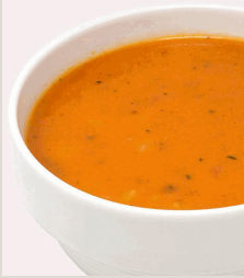
BIO Tomatensuppe* mit Reis